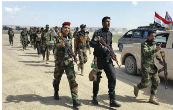
qu'elles sont sous le contrôle du gouvernement irakien».

La dernière étape de la bataille de Ramadi a fait en trois jours au moins 500 morts, civils et soldats, selon des responsables. Les Etats-Unis, alliés de poids de Bagdad, ont reconnu lundi que les milices chiites, dont certaines sont soutenues par l'Iran, avaient «un rôle à jouer à Ramadi tant