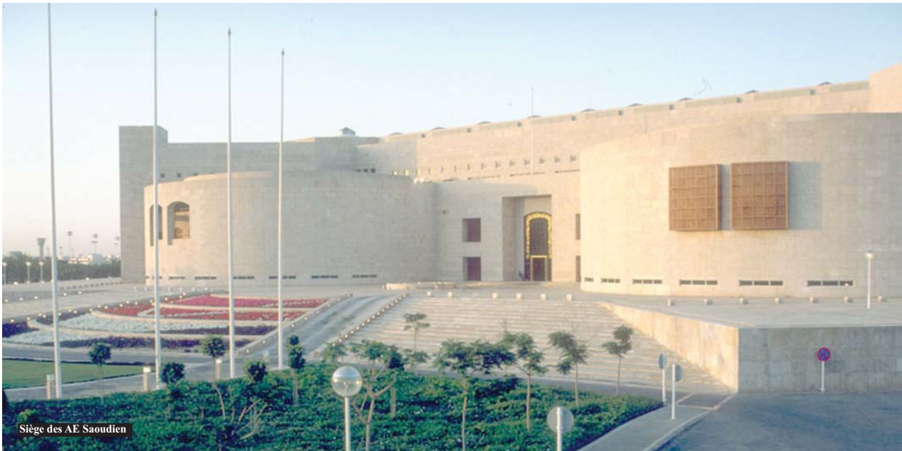
Siège des AE Saoudien

Le ministère saoudien des Affaires étrangères vient de demander aux ministères de l'Industrie et du Commerce ainsi que le Conseil de la monnaie saoudienne, de faire preuve de «vigilance» dans les transactions financières avec onze pays, dont l'Algérie, afin de «parer aux risques d'implication dans des affaires de blanchiment d'argent ou de financement de terrorisme». Cette mesure intervient alors le Groupe d'action financière (Gafi) a porté l'Algérie sur la liste des États, dont la législation de lutte contre le terrorisme ne répond pas aux normes.