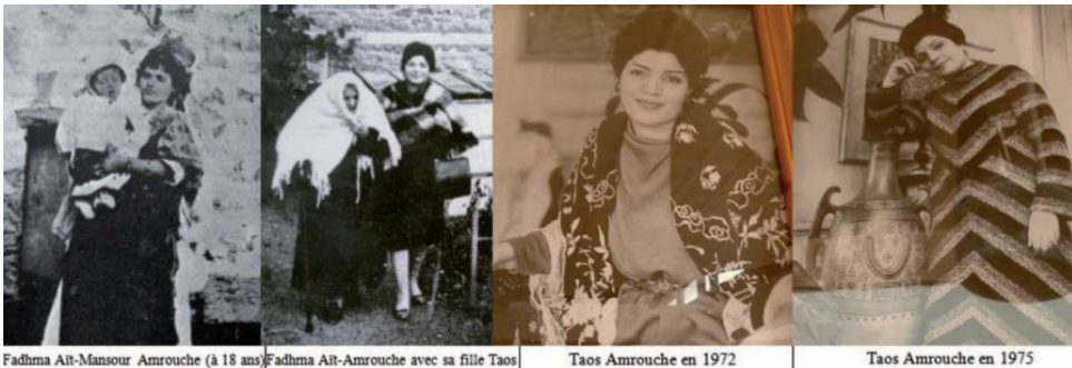
Fadhma Ait-Mansour Amrouche (à 18 ans) / Fadhma Ait-Amrouche avec sa fille Taos / Taos Amrouche en 1972 / Taos Amrouche en 1975

Naître sans raison et mourir pour une raison. Sa mort n'est que physique, et son âme éternelle est une substitution aux valeurs manquantes face aux altérations tous genres. La figure réelle dans celle imaginaire. Le concret succédant à la théorie.